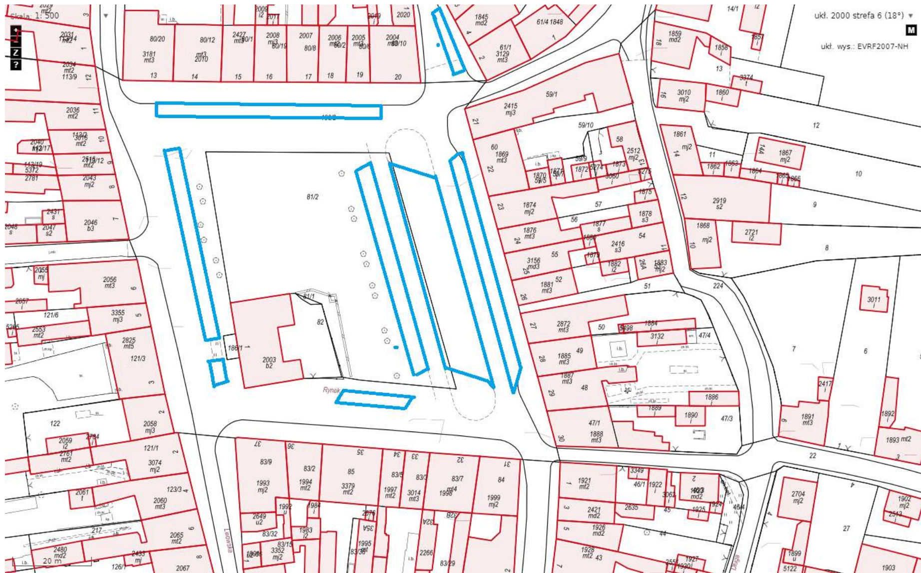
Strefa Płatno Parkowania ul. Rynek