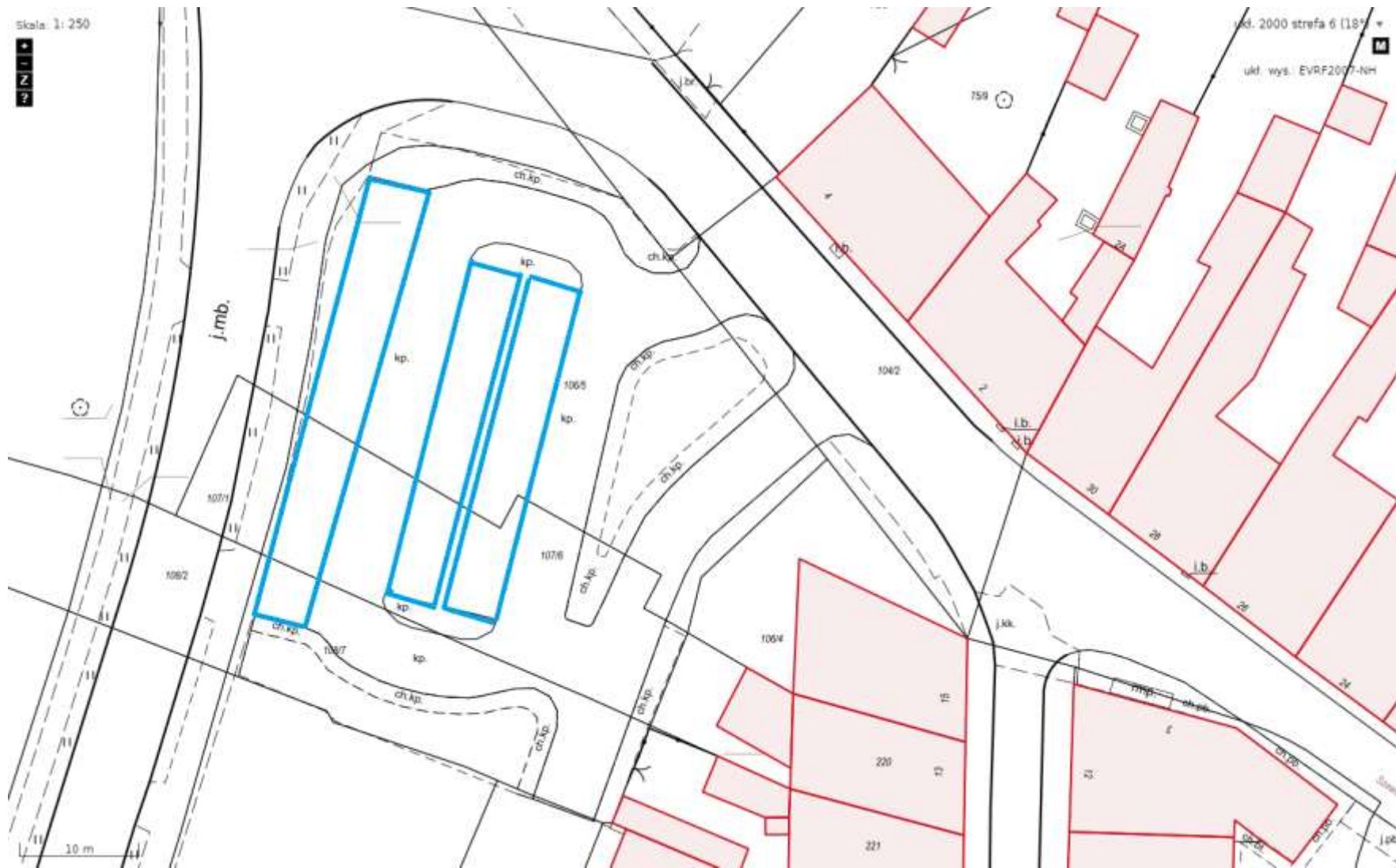
Strefa Płatnego Parkowania ul. Krotoszyńska