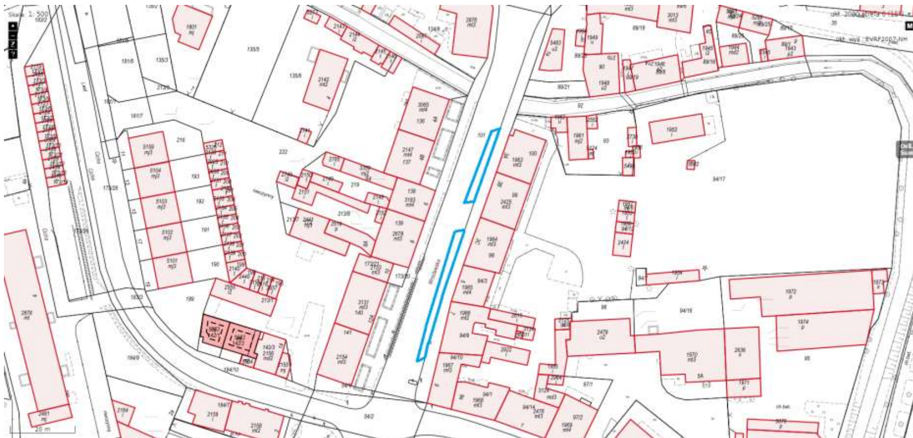
Sreza Płatnego Parkowania ul. Wrocławska