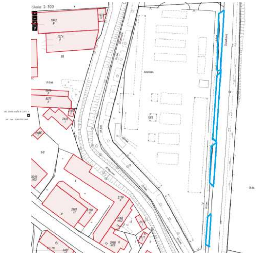
Strefa Płatnego Parkowania ul. Działkowa